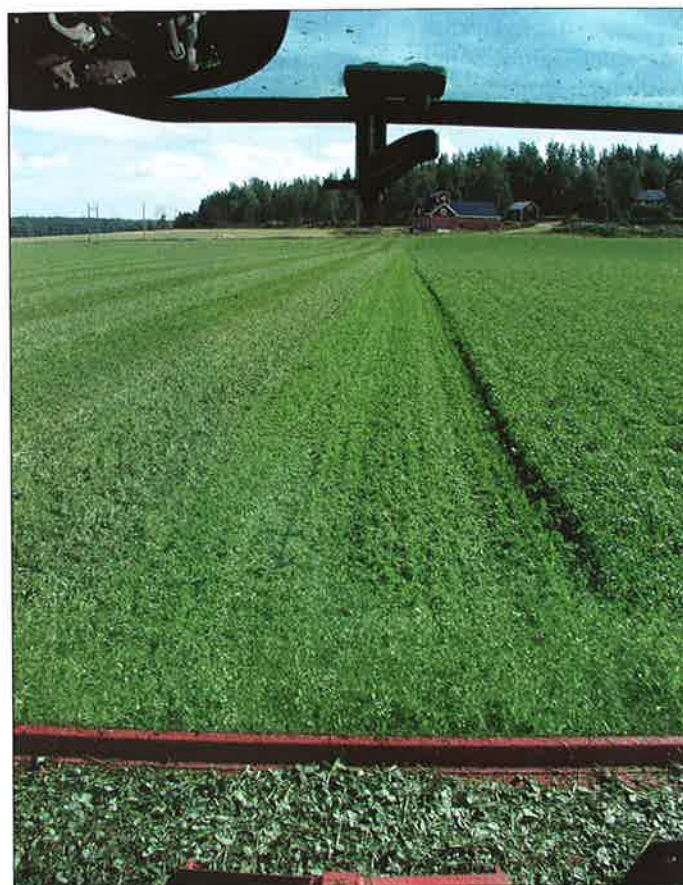
■ Vid snabb torkning är kväveförlusterna från avslagen grönmassa låga.