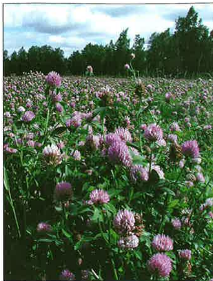
■ Rödklöverfröodlingar tillförda mellan 400 och 500 kg kväve/ha (Närpes).

kg N/ha och år, men i 10 % av fallen uppgick kväveskörderna ännu till 250–300 kg N/ha och år.