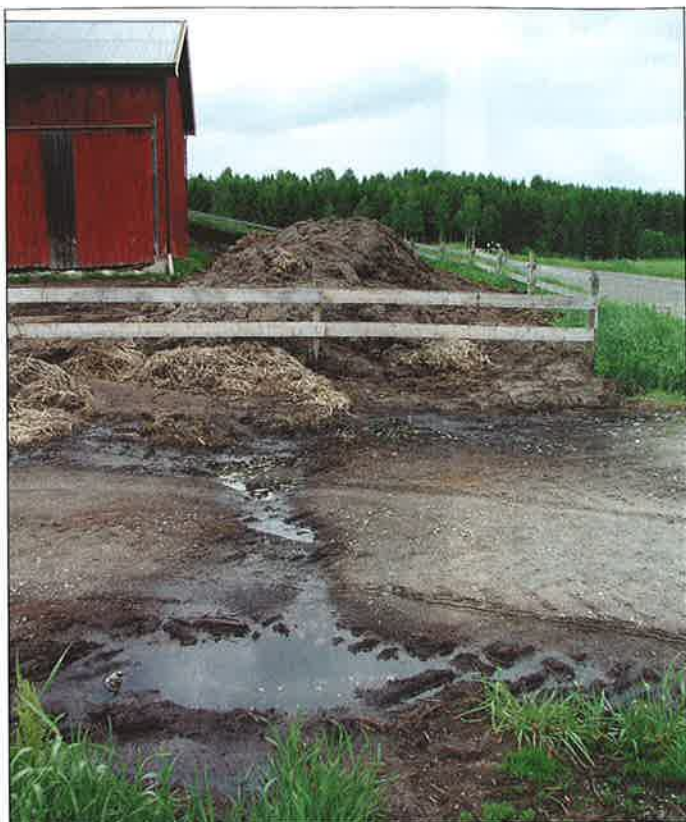
■ Kväve som har fixerats från luften förloras delvis under lagringen och vid spridningen av stallgödsel. Ifall gödselstaden läcker förlorar man dessutom stora mängder av näringsämnen, såsom fosfor och kalium (bilden är tagen utomlands).