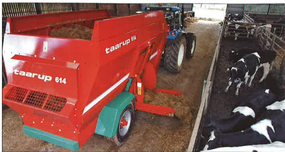
■ Utfodring med fullfoder förenklar blandningen av partier med olika klöverinnehåll.

sådant ensilage mera lagringsstabil just tack vare innehållet av buffrande substanser.