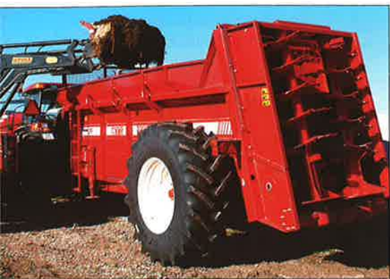
■ Med stallgödsel tillförs vallen avsevärda mängder kalium.

Rybs och rybskross måste alltså undvikas ifall man har problem med höga kaliumhalter i foderstaten. Man bör vidare se till att magnesiumhalten i totalfoderstaten ligger mellan 2 och 3 g/kg ts. Extra tillskott av ADE-vitaminer har gett goda resultat.