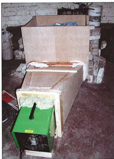
■ Efter sortering torkades klöver och gräs var för sig.

En analys av produktionsresultaten visar att spridningen mellan vallar av samma ålder är stor. Vallskördar, klöverandelar och foderkvalitet påverkas av